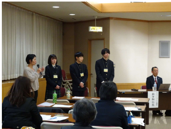
たくさんのヒントやつながりが得られた 実践交流ラウンドテーブル！