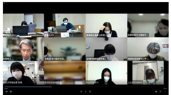
オンラインの様子