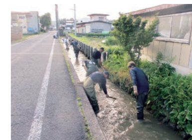
川草や岸辺の草の刈り払い