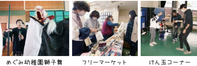
めぐみ幼稚園獅子舞 フリーマーケット けん玉コーナー