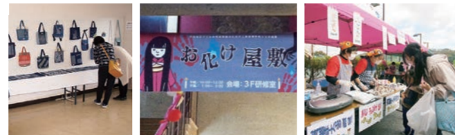
長井さしこ教室展示 お化け屋敷 売店・キッチンカー