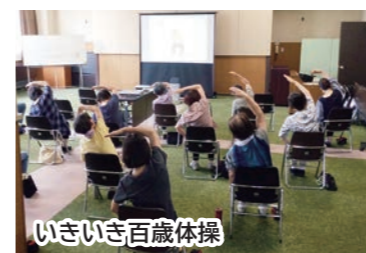
いきいき百歳体操

健康安全専門部の活動として始めた「いきいき百歳体操」と「長井小学校の下校見守り」も、早いもので1年になりました。体操はいつでも誰でも参加OK。火曜日の9時30分から40分間の活動です。また、見守り活動は、小学生も顔を覚えてくれて、元気に挨拶してくれるようになりました。