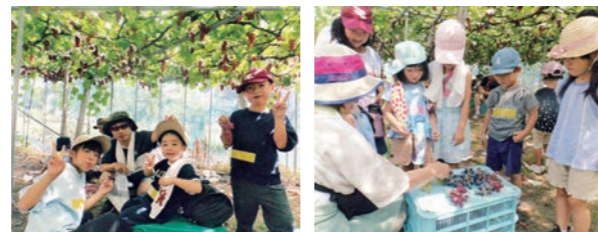
おいしいぶどうに大満足! 違う種類のぶどうも試食

道の駅からバスに乗り、伊佐沢の安部ぶどう園に行ってぶどう狩りを体験しました。たくさん実ったデラウェアにパパも子どもたちもニコリ笑顔。お腹いっぱいになるまで1粒1粒おいしくいただきました。ママにもお土産を買って帰りました。