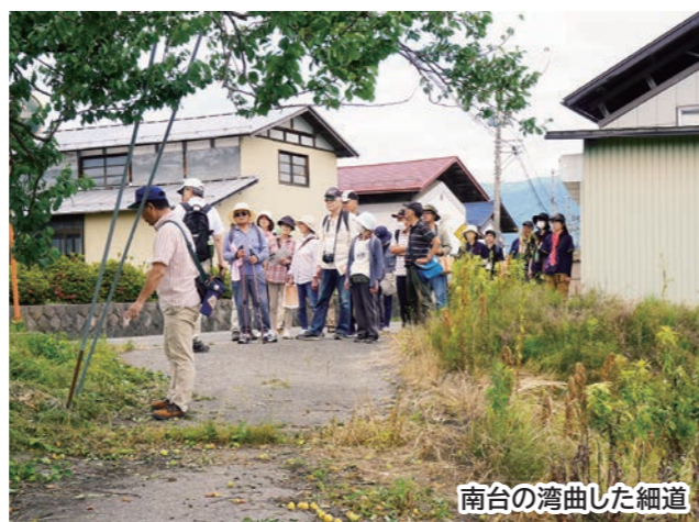
南台の湾曲した細道

今年の「ほそみち」は、市民文化会館から荒館(現館町北)を通り、旧越後街道の発着点である四ツ