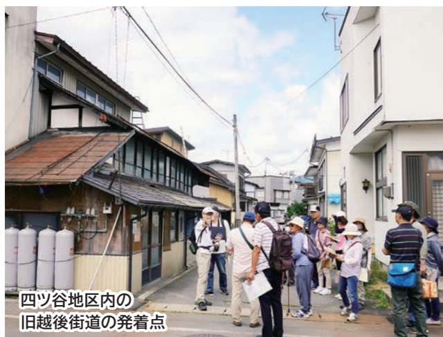
四ツ谷地区内の旧越後街道の発着点