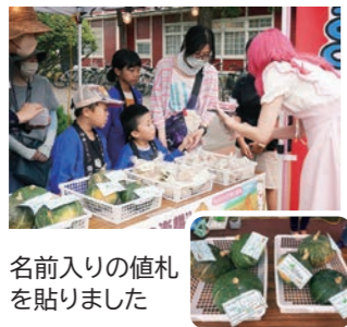
名前入りの値札を貼りました

今年初めての野菜販売体験を9月2日(土)に行いました。当日の朝に野菜の収穫をし、袋詰めした野菜に子どもたちが作成した値札を貼り、仕入れの数は? 売上金は?と、事前学習を済ませ準備完了です。会場では、「〇〇ちゃんの野菜をください」の声に、緊張しながらも元気に受け答えしていました。今後は、秋野菜の販売体験を楽しみにしています。