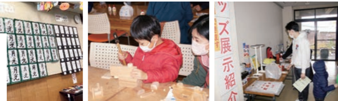
作品展示 木の自動車作り 防災グッズ展示紹介

発表や作品展示、スポーツ体験やものづくり体験など楽しいことが盛りだくさん! お茶会やお化け屋敷、スタンプラリー福引、おいしい食べ物もありますよ。みなさまお誘いあわせのうえ、ぜひご来場ください。 *内容は変更になる場合もあります。