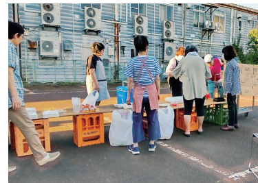
定番の『やきそば』作り