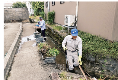
河川と側溝の清掃作業

本地区の自主防災組織設立は令和4年4月で、昨年12月には新市役所での施設見学と8月3日の豪雨災害を受けての防災研修会を実施しました。今年度については7月17日開催の第16回本町北夏祭りの際に防災活動の組み入れも考えておりましたが、まだコロナ感染も収まらぬことから祭り定番の『やきそば』作りのみに留め実施しました。