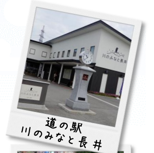
道の駅 川のみなと長井